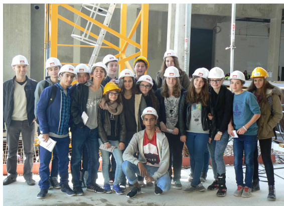
Groupe d'élèves de 3ème option DP3