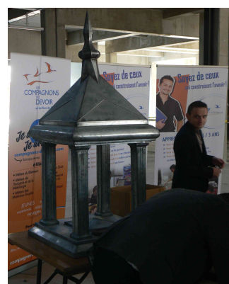
Les compagnons du devoir

Lors des coulisses du bâtiment organisées par la Fédération Française du Bâtiment , le vendredi 09 octobre 2015, dix sept élèves de 3ème option DP3 du collège Christiane Perceret de Semur en Auxois ont visité un chantier et découvert le nouveau quartier Jean Jaurès de Dijon.