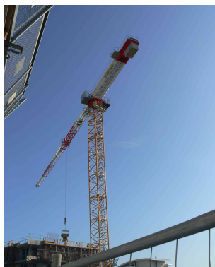
Grue sur le chantier