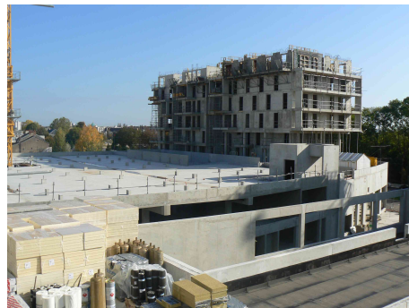
Chantier centre commercial et habitat